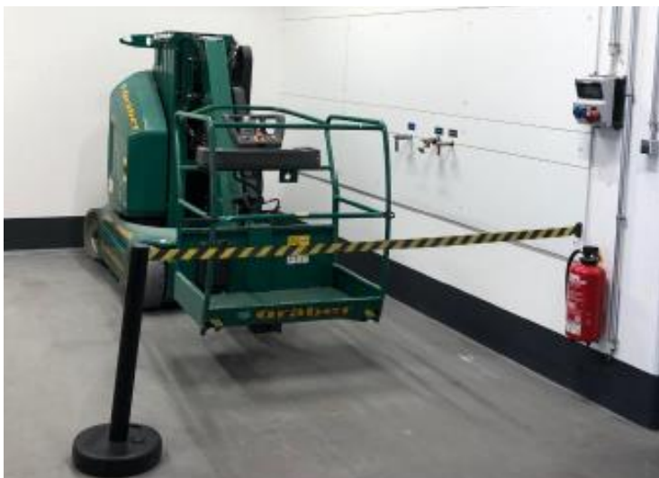
Abb. 3: Übergabeplatz Mietgeräte